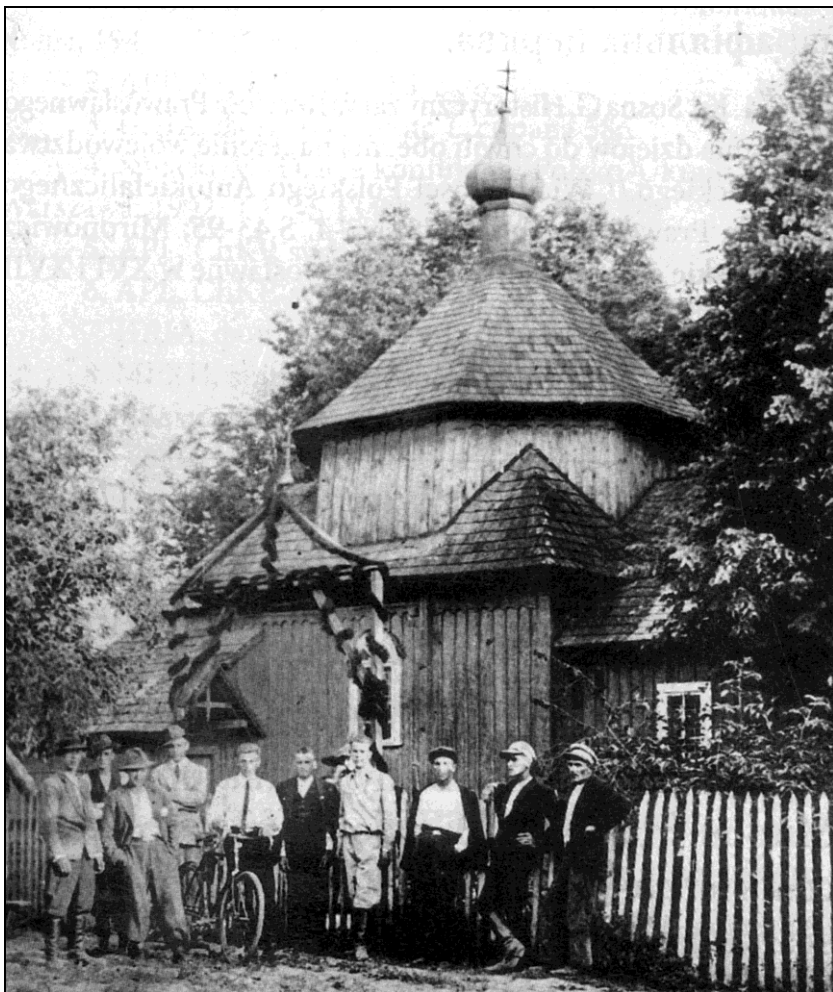
Rys. 2 Cerkiew p.w. Kuźmy i Damiana w Przeorsku wybudowana pod koniec XVIII lub na początku XIX wieku 44 . Stan na 1837 r. (Źródło: В. Слободян, dz. cyt. , s. 324.)